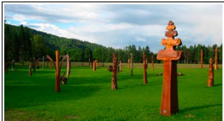
Skulpturenpark Schloß Albeck – Kärntens größter Holzskulpturenpark!

Von Budapest bis Broadway, von der Operette bis zum opernhaften